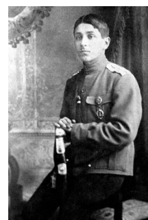
Зощенко в звании прапорщика в 1915 г.

За время войны Зощенко был неоднократно ранен, а также получил серьезное химическое отравление после газовой атаки. Доктора признали его непригодным для несения военной службы и отправили в запас.