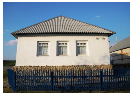
В Курской области открыли после реставрации дом-музей писателя

Отца своего писатель не знал. В деревне считали его сыном белого офицера. Отчим, вернувшись после Первой мировой войны и германского плена, усыновил его. По воспоминаниям жены Воробьева, писатель всегда вспоминал об отчине «с чувством любви и благодарности за то, что тот никогда не упрекнул его куском хлеба, никогда не тронул, как говорится, и пальцем». От матери Воробьев унаследовал резкий, беспокойный, не терпящий несправедливости характер. Детство Воробьева, несмотря на большую семью, было одиноким и не слишком радостным. «Мне всегда хотелось есть, — вспоминал он, — потому что никогда не приходилось наесться досыта — семья большая, жизнь была трудной, и я не был способен попросить, чувствуя себя лишним ртом, чужаком». Все то, что он пережил в детстве, Константин Воробьев впоследствии отразил в своих произведениях. В первую очередь речь идет о его деревенской прозе повести «Друг мой Момич», а также «Почем в Ракитном радости» и «Синель».