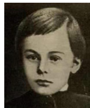
Детский портрет Гоголя