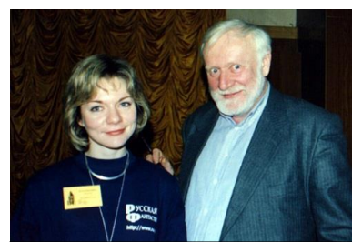
Кир Булычев и Наташа Гусева (исполнительница роли Алисы)

В 1985 году выпустил повесть из серии про Алису «Заповедник сказок». В работе литератор отошел от привычных канонов и отправил героиню не на чужую планету, а в сказочный мир. По сюжетам книг о юной девочке сняты киноленты.