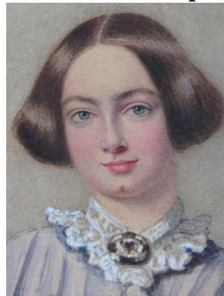
Портрет Шарлотты Бронте в детстве

Шарлотта родилась в Западном Йоркшире, в Торнон 21 апреля 1816 года, в семье церковнослужителя. Отца будущей писательницы звали Парик Бронте, его родиной была Ирландия, а мать Мария Брэннуэл, она смотрела за детьми и вела домашнее хозяйство. В семье Бронте было шестеро детей, пять девочек и один мальчик. Шарлотта была третьим ребёнком. Дочерей звали: Мэри, Элизабет, Энн и Эмили, а сына Патрик Бренуэлл.