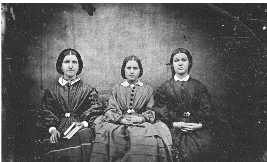
Шарлотта Бронте с сестрами

Серьёзным дебютным произведением Шарлотты Бронте можно считать роман «Учитель», который был опубликован уже посмертно в 1857 году. Издать его при жизни у неё не получилось, ни одно издательство не приняло рукопись, ссылаясь на то, что произведение не увлекает.