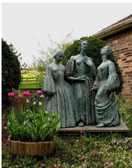
Памятник сестрам Бронте

Зимой 1855 года она стала плохо себя чувствовать. В феврале её осматривал врач, и заверил писательницу, что её недомогания следствие раннего токсикоза, и её жизни ничего не угрожает. Но Шарлотту не переставали мучать отсутствие аппетита и постоянная тошнота. Результатом стала сильная слабость, что в последствии вылилось в истощение.