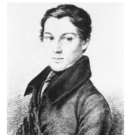
Иван Крылов в юности